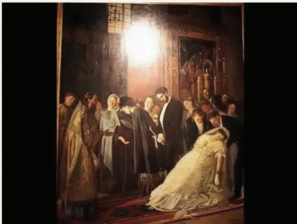
Василий Пукирев. Прерванное венчание. 1877 г.

Брачный обыск обычно включал в себя следующие основные пункты: место жительства, возраст, отсутствие плотского и духовного родства и свойства, семейное положение жениха и невесты, а также согласие родителей или других лиц, согласие которых требуется по закону, и взаимное согласие самих брачующихся.