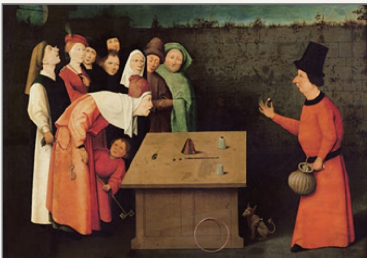
Неизвестный автор. Фокусник (1475—1480)

Обвести вокруг пальца — значит ловко обмануть, перехитрить. Представьте фокусника: он отвлекает вас движением одной руки, а второй незаметно проводит нужное действие. Собеседник же думает, что все под контролем, а в итоге оказывается в дураках.