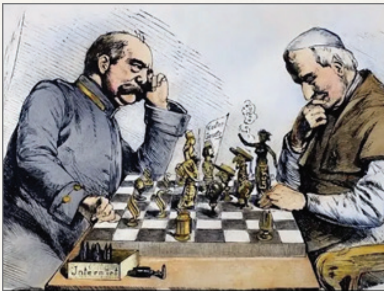
Между Берлином и Римом. Бисмарк противостоит папе Пию IX. Карикатура 1875 г.

Однако в XIX в. борьба власти и церкви приняла более цивилизованный характер. Яркий пример — Германская империя.