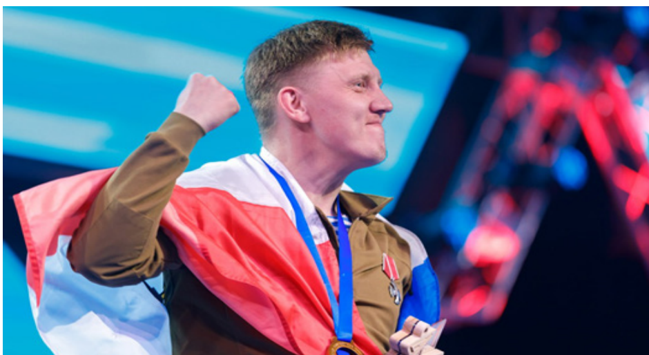
«Кубок защитников Отечества» по зимним видам спорта, Ханты-Мансийск (2025)

регионального уровня. Благодаря совместным усилиям около трех тысяч ветеранов спецоперации с инвалидностью сегодня систематически занимаются различными видами адаптивного спорта, более 500 защитников вошли в спортивные сборные команды субъектов РФ, а около 30 героев — в составы национальных сборных команд. С 2023 г. фонд проводит соревнования «Кубок защитников Отечества». С прошлого года перечень дисциплин этих состязаний значительно расширился: теперь ветераны соревнуются, например, в спортивном метании ножа, а также появились специальные дисциплины для ветеранов с нарушением зрения — пауэрлифтинг и настольный теннис для слепых (шоудаун). Благодаря активному продвижению фондом идеи спортивной реабилитации в России параллельно развивается и общая инфраструктура для занятий адаптивным спортом, доступная теперь не только ветеранам, но и всем гражданам с инвалидностью 10 .