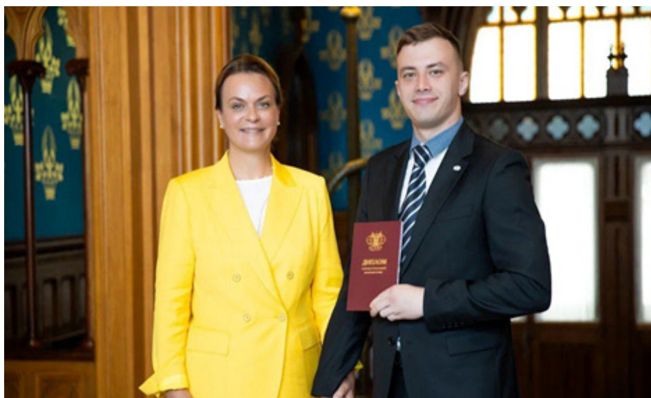
Церемония вручения дипломов ветеранам СВО в рамках программы профессиональной переподготовки «Управление городской инфраструктурой и развитием территорий» (2025)

Особой популярностью среди защитников пользуются меры поддержки в сфере предпринимательства: в прошлом году более 200 ветеранов стали успешными бизнесменами и открыли свое дело, в том числе благодаря возможностям социального контракта 7 .