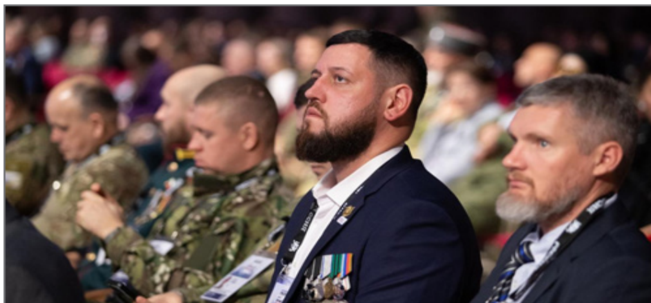
Участники форума ветеранов специальной военной операции «Вместе победим» (2025)

Немаловажным направлением работы фонда является патриотическое воспитание детей и молодежи, сохранение исторической памяти. Герои при содействии филиалов фонда регулярно проводят в школах и вузах уроки мужества, лекции и встречи. За время своей деятельности фонд провел уже 35 тысяч таких патриотических мероприятий, ежегодно организует масштабный творческий конкурс «Памяти героев верны»: в 2025 г. в нем соревновались более 10 тысяч человек, представивших эссе и рассказы, посвященные героям специальной военной операции и династиям защитников Отечества.