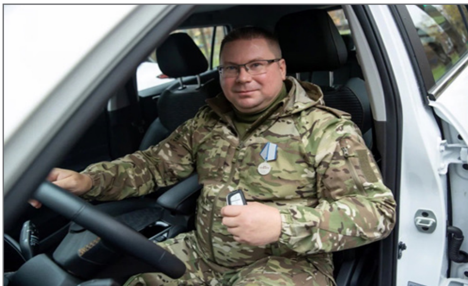
Передача ключей от автомобиля с ручным управлением ветерану СВО, Реутов (2025)

Фонд делает все для того, чтобы наши герои могли получать необходимую помощь комплексно, в максимально комфортных условиях и желательно ближе к дому. Важно, чтобы не только при установке протеза, но и при его замене и обслуживании нашим защитникам с инвалидностью не приходилось ездить в другие регионы 8 . В прошлом году фонд совместно с Министерством обороны РФ разработал и внедрил стандарт комплексной услуги протезирования военнослужащих, получивших ранения в зоне СВО. Благодаря его внедрению и развитию сети центров реабилитации и протезирования удалось снизить время ожидания начала процедуры в четыре раза. Новому стандарту сейчас соответствуют 36 российских предприятий, где защитникам доступен полный комплекс услуг: реабилитация, протезирование, обучение пользованию протезом 9 .