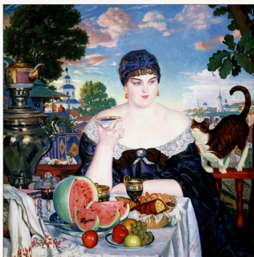
Кустодиев Б. М. Купчиха за чаем (1918 г.)

Так, историк Галина Ульянова в своей книге «Купчихи, дворянки, магнатки: женщины-предпринимательницы в России XIX века» показала, что, наряду с патриархальным укладом в купеческих семьях, в XVIII—XIX вв. в России существовала целая когорта женщин, являющихся главой семейного дела.