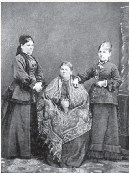
Купчиха с дочерьми. Фотография XIX в.

В отличие от современного российского законодательства, в XIX в. не существовало такой категории, как «совместно нажитое в браке имущество». Каждый супруг наживал свое имущество отдельно, и по взаимному согласию супруги могли только пользоваться, например, городским особняком или сельской усадьбой, принадлежавшими одному из них.