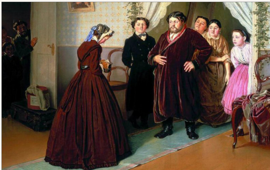
Перов В. Приезд гувернантки в купеческий дом (1866 г.)

Известный лозунг «Все лучшее — детям» отечественные купцы посчитали бы дикостью.