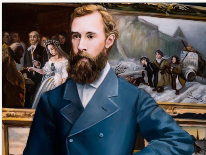
Павел Третьяков. Конец XIX в.

Третьяковы — одна из самых известных династий России. Братья Павел и Сергей Третьяковы были не только коллекционерами и меценатами, но и крупными общественными деятелями и предпринимателями, чей вклад в развитие российской культуры и социальной жизни достоин особого внимания и восхищения. В 1892 г. Павел Третьяков передал всю свою коллекцию картин, а также здание, где она находилась, в дар Москве.