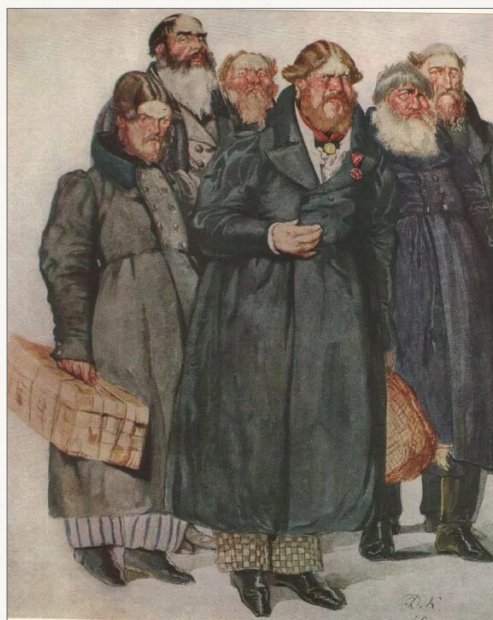
Кардовский Д. Купцы у Хлестакова

«Это — мир затаенной, тихо вздыхающей скорби, мир тупой, ноющей боли, мир тюремного гробового безмолвия... нет ни света, ни тепла, ни простора. Гнилью и сыростью веет темная и низкая тюрьма. Ни один звук с вольного воздуха, ни один луч света не проникает в нее».