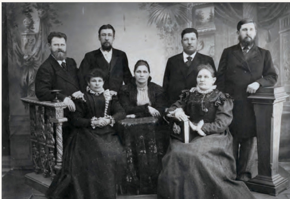
Купеческая семья. Фотография середины XIX в.

Император сдержал свое слово. К Михаилу Королеву в дом, где он жил, набилось все московское купечество, занимавшее высокое положение. Императрицу Марию Александровну хозяйка угощала чаем из самовара, а мужчины в это время беседовали о судьбах российской промышленности и о том, что необходимо обратить внимание государства на отечественного производителя.