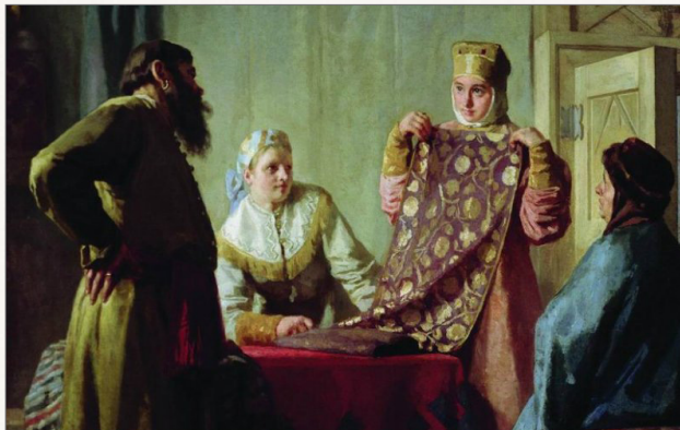
Невреев Н. Бытовая сцена XVII века (Купец и товар) (начало 1890-х гг.)

Расцвет российского предпринимательства, особенно в конце XIX — начале XX в. был связан с деятельностью нескольких поколений русского купечества, которое являлось носителем традиционного образа жизни.