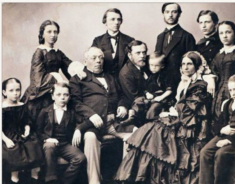
Семья Мамонтовых. Фотография середины XIX в.

Первые известные нам семейные династии российских предпринимателей начали складываться уже в едином Московском государстве, при царе Иване Грозном. К XV в. относится формирование династии русских предпринимателей Строгановых, основателем которой был Аника Федорович, разбогатевший на добыче соли на Кольской губе. В то же время началась история таких известных купеческих фамилий, как Никитниковы, Шорины, Светешниковы, Веневитиновы, развивавших торговлю внутри страны, с новыми присоединенными территориями Зауралья и заграничными территориями.