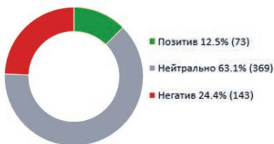
Рис. 1. Тональность в соцмедиа