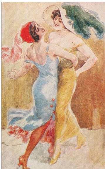
Открытие времен нэпа

Корней Чуковский вспоминал: «Очень я втянулся в эту странную жизнь и полюбил много и многих... пробегая по улице — к Филиппову за хлебом или в будочку за яблоками, я замечал одно у всех выражение — счастья. Мужчины счастливы, что на свете есть карты, бега, вина и женщины; женщины