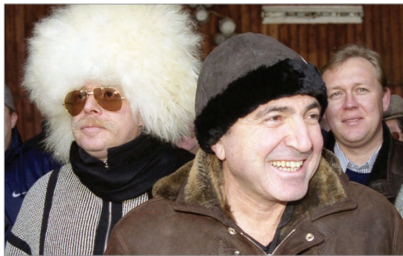
Б. Березовский и Б. Патаркацишвили. Фото начала 1990-х гг.