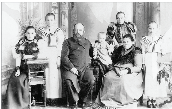
Семья купца первой гильдии. Конец XIX в.

Нужно сказать, что в начале XX в. купечество значительно отличалось своим жизненным укладом от купцов — героев пьес А. Н. Островского. Долгополые сюртуки,