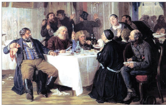
Ф. Журавлев. «Купеческие поминки». 1876 г.

«Законы рынка» 1990-х гг. были жесткие, как и люди, сделавшие в то время свои миллионные состояния. Так, однажды российский и грузинский олигарх Бадри Патаркацишвили находился на лечении в одной из клиник Германии. В палату ему принесли договор на оказание медицинских услуг на немецком языке. Патаркацишвили немецкий язык не знал и подписал договор, как говорится «не глядя». Увидев это, немецкие врачи начали смеяться,