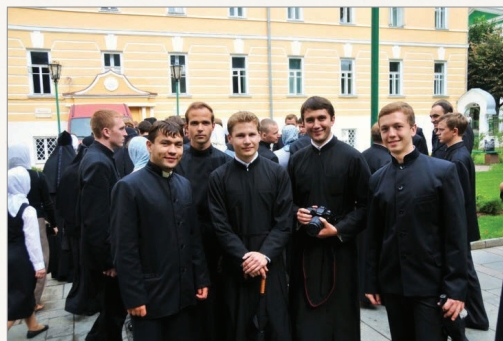
В минуты отдыха