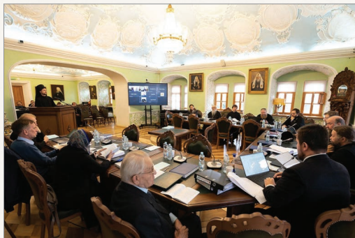
Заседание диссертационного совета

А вот чтобы стать соискателем докторской степени, необходимо подать прошение, к которому в числе прочего необходимо представить план диссертации и обоснование темы исследования, список научных и научно-богословских публикаций. При этом обоснование темы исследования должно включать: объект, предмет, цель, задачи, методы исследования, источниковую базу, хронологические