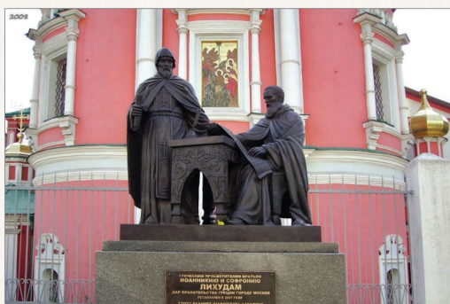
Памятник братьям Лихудам в Москве у Богоявленского собора

Бронзовый памятник братьям Лихудам установлен в 2007 г. в Москве, напротив выхода со станции метро «Площадь Революции», у Богоявленского собора, где первоначально находилась духовная школа, а затем Славяно-греко-латинская академия.