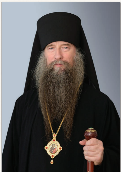
Глава Московской духовной академии (ректор) — епископ Звенигородский Кирилл

С началом серьезных общественно-политических преобразований в России все ограничения, с помощью которых советская власть пыталась затормозить развитие духовных школ и богословской науки, были полностью сняты, однако не преминули появиться новые трудности, связанные главным образом со сложным экономическим положением в стране и с ограниченным финансированием духовного образования.