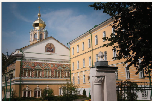
Московская духовная академия (Сергиев Посад)

Еще в 1667 г. прихожане Богоявленской церкви подали царю прошение о дозволении открыть духовную школу. В нее собрали около 30 учеников. Эта школа стала основой Славяно-греко-латинской академии, открывшейся в 1685 г. как всеобщее высшее образовательное учреждение. Славяно-греко-латинская академия дала начало всему высшему образованию в России. Первыми преподавателями Академии стали греческие монахи и ученые-богословы братья Иоанникий и Софроний Лихуды, получившие знания в Падуанском университете, одном из старейших университетов Европы.