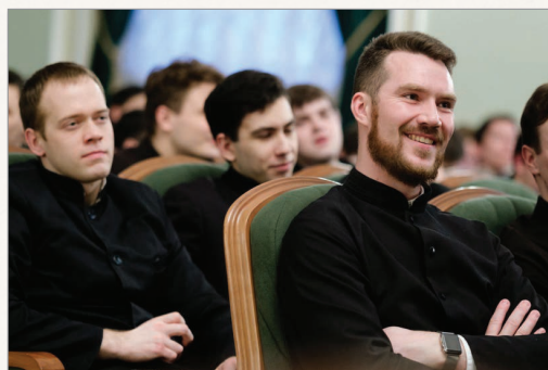
Лекция в Духовной академии

На каждом курсе ответственным лицом является староста. В его обязанности входит ежедневное уведомление руководства Академии об отсутствующих на занятиях по состоянию здоровья, в связи с послушанием или по иным причинам.