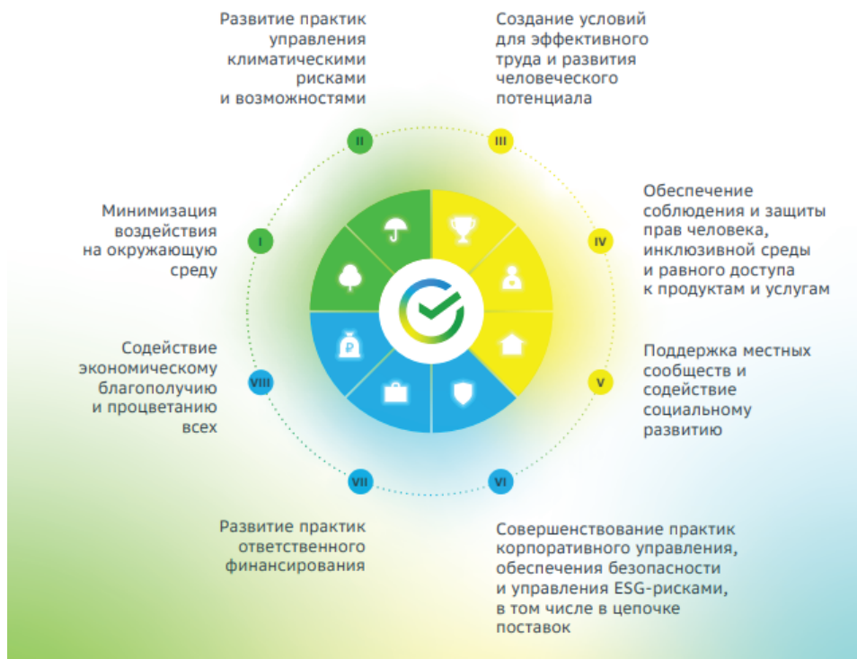
Рис. 2. Направления деятельности Сбера в области ESG и устойчивого развития

Реализация Политики подразумевает деятельность в 8 ключевых направлениях , сконцентрированную на решении 45 задач с учетом трёх сквозных подходов