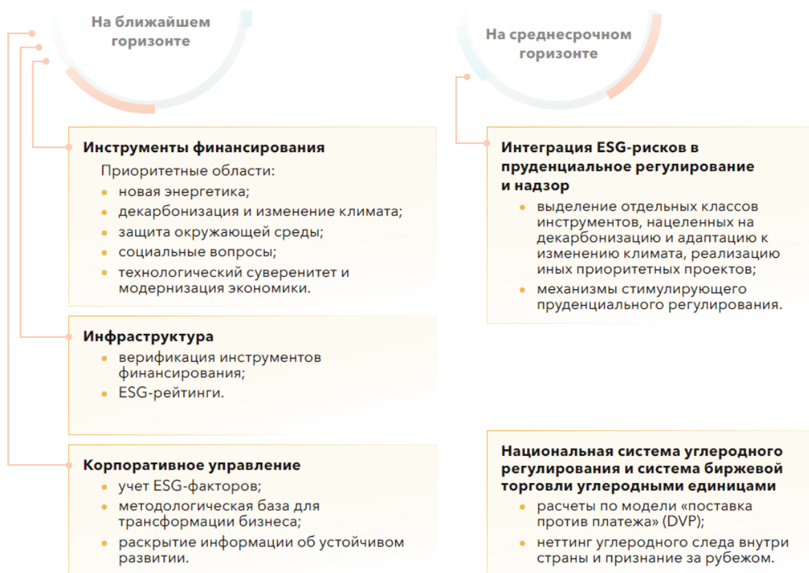
Рис. 3. Основные направления развития ESG-банкинга в России

Основные направления развития ESG-банкинга в России на современном этапе, по мнению банковского сообщества, выглядят следующим образом 15 (см. рис. 3).