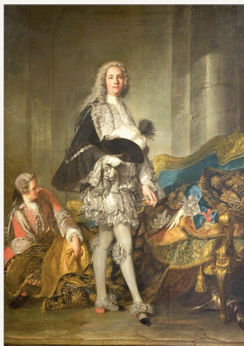
Герцог де Ришелье (картина Жана-Марка Натье, 1732 г.)

взломана, в ней обнаружили страшную картину: одна из женщин была мертва, а вторая умирала, истекая кровью.