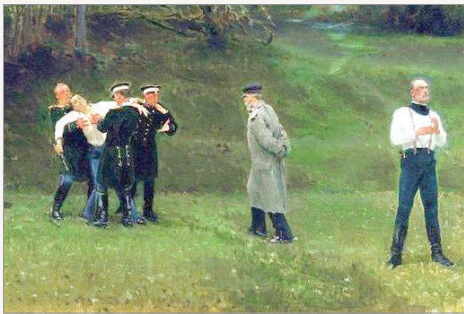
Илья Репин. Дуэль. 1897 г.

Согласно Манифесту Николая I от 25 июня 1839 г. наказание за участие в дуэли содержала часть 5 книги 1 Свода военных