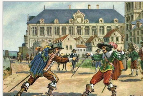
Дуэль во Франции, XVIII век

Для дворянина честь никогда не была эфемерным понятием: наравне с особыми правами, положенными ему по статусу, он имел и особые обязанности перед государством, но главное — перед своими предками. Дворянин не имел морального права не соответствовать своему происхождению, а поскольку социальная