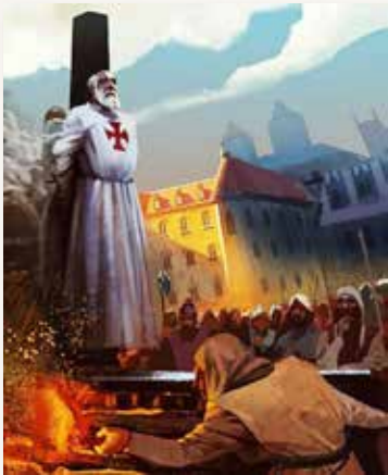
Жак де Моле

18 марта 1314 г. Жака де Моле, покалеченного и едва живого старика, привезли на площадь, где для него был сложен огромный костер. Магистра привязали к столбу. И тут случилось невероятное — трясущийся слабый старик, который едва говорил, вдруг взглянул ясным взглядом прямо в глаза королю и заговорил сильным громким голосом, который перекрыл гул толпы, и было отчетливо слышно каждое слово.