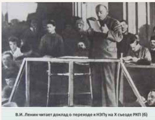
В.И. Ленин читает доклад о переходе к НЭПу на X съезде РКП (б)

интервенты вывезли с собой пушнины, шерсти, леса, нефти, марганца, зерна, промышленного оборудования на многие миллионы золотых рублей.