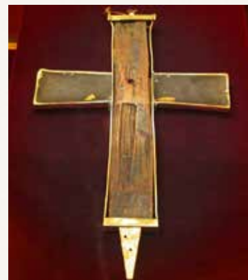
Фрагмент Животворящего Креста Господня в дворцовой сокровищнице Габсбургов в Вене

История Креста на этом не была закончена. В 638 г. Иерусалим сдался арабскому войску, начавшему победное распространение мусульманской веры на Востоке. Крест разделили на части и вывезли кораблями в Константинополь и другие места. Одну из частей спустя некоторое время вернули обратно в Иерусалим, где она хранилась до эпохи Крестовых походов.