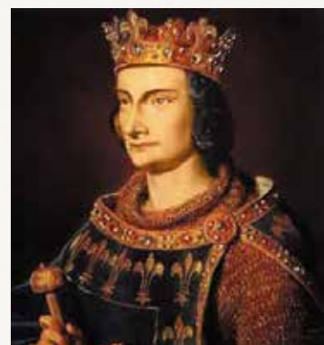
Филипп IV Красивый

Именно Филипп Красивый стал причиной исчезновения ордена тамплиеров. Причина: несметные богатства, накопленные тамплиерами. По-