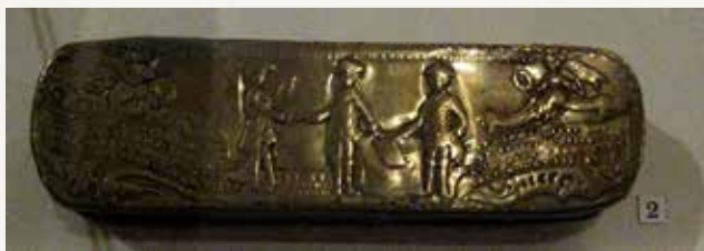
Табакерка «Рукопожатие двух монархов», на которой символически изображено заключение Петербургского мирного договора 1762 г. между Петром III и Фридрихом II

Трудно найти в отечественной истории другого самодержца, кроме Петра III, который за необычайно краткий срок своего царствования — всего полгода — сумел бы совершить такое множество противоречивых поступков и заслужить столь противоречивые оценки современников и потомков. Его называют продолжателем петровских реформ и одновременно считают человеком, который искренне не любил Россию. Ему приписывают послабления во внутренней политике и ставят в вину разбазаривание завоеваний, добытых кровью русских солдат.